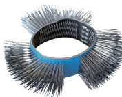
软刷 103 x 23 mm 052598