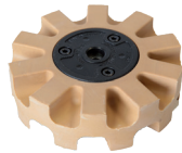
橡胶轮 115 x 14 mm 051874