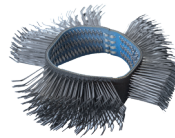
硬刷 103 x 23 mm 051812