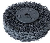
打磨轮 115 x 14 mm 051843