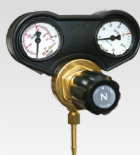
Regulátor 30 l/min 041622 041219 041646