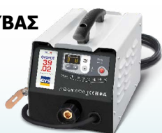
PROLINER 39.02 - ref. 035775 PROLINER 39.04 - κωδ. 035782