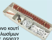
Χαλύβδινο κουτί αναλωσίμων ref. 050037