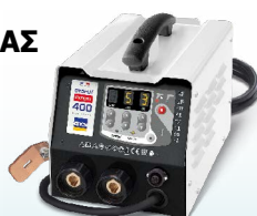
PROLINER PRO 230 - ref. 035799 PROLINER PRO 400 - κωδ. 035805