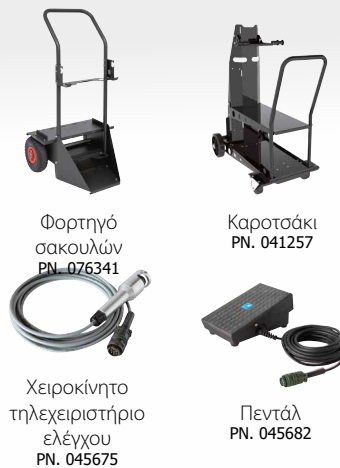
Φορητό σακουλών PN. 076341