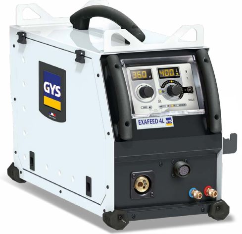
Tarnitakse ilma lisaseadmeteta