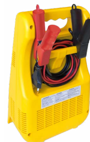
Logement pour rangement des câbles et pinces.