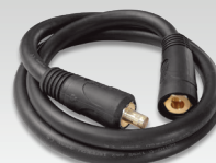
Câble d'inversion de polarité 033689