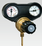
Manomètre 30L/min 🇫🇷 041622 🇩🇪 041219 🇬🇧 041646