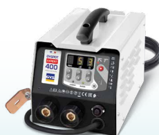
PROLINER PRO 230 - ref. 035799 PROLINER PRO 400 - ref. 035805