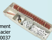
Boîte complément débosselage acier ref. 050037