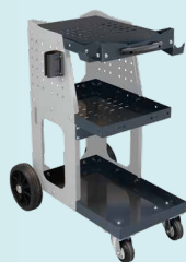
Chariot SPOT 800 ref. 051331