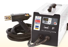
PROLINER ALU PRO FV - ref. 035836