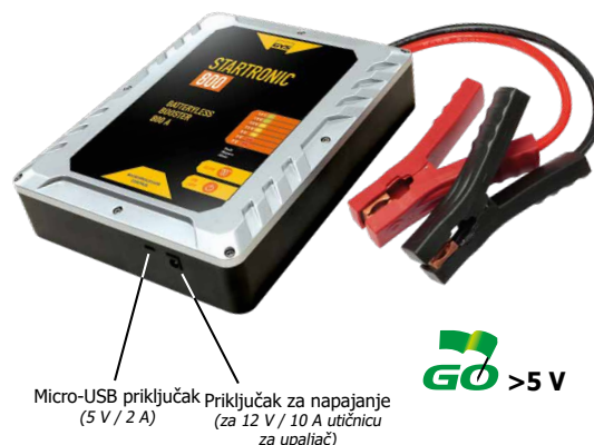
Micro-USB priključak (5 V / 2 A) Priključak za napajanje (za 12 V / 10 A utičnicu za upaljač)