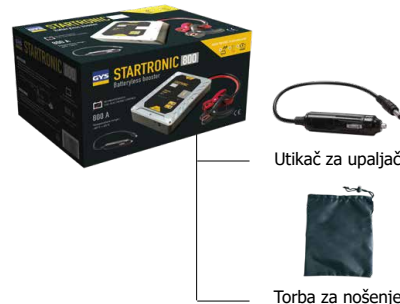
Utičać za upaljač