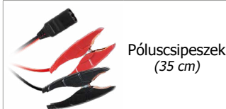
Póluscsipeszek (35 cm)