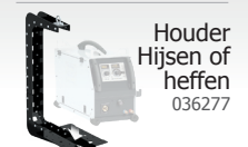
Hooper Hijsen of heffen 036277