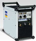
EXAGON 400 010925