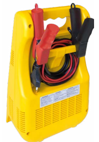
Oppbevaring av kabler og klemmer i enheten.