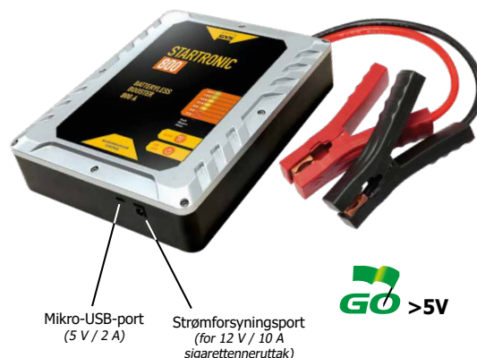
Mikro-USB-port (5 V / 2 A)