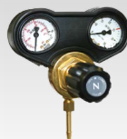
Regulator 30L/min 041622 041219 041646