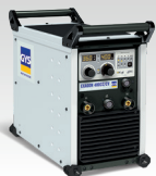
EXAGON 400 010925