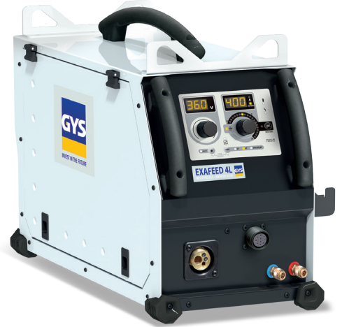
Entregue sem acessórios