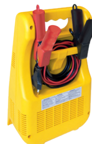
Depozitarea cablurilor și a cleștilor.