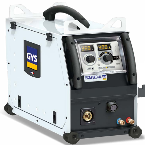
Livrat fără accesorii