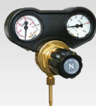
Regulator 30L/min 041622 041219 041646