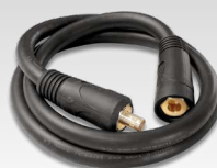
Cablu de inversare a polarității 033689