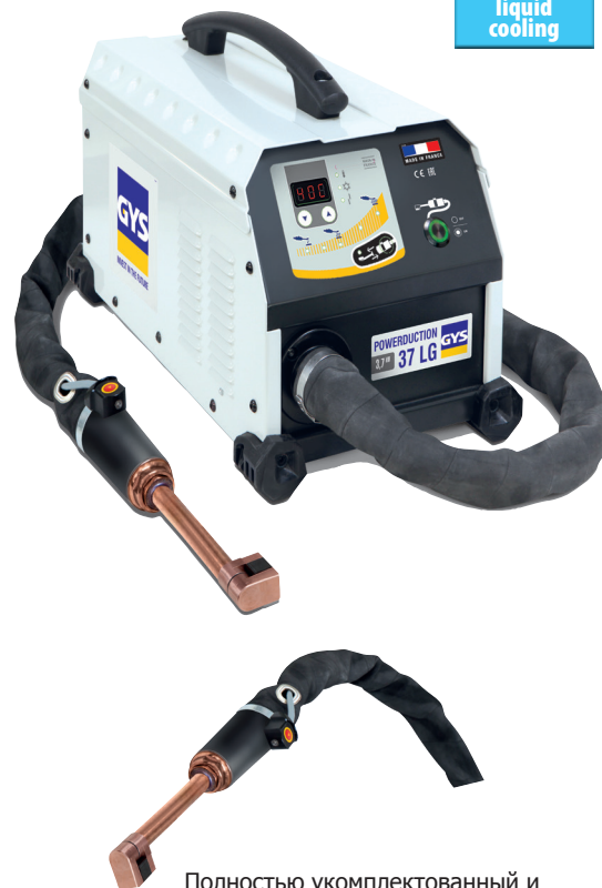
Полностью укомплектованный и смонтированный источник с 1 индуктором 90°.