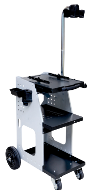
ref. 051331 + 052284 UNIVERSAL 800 + кронштейн