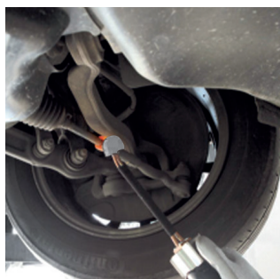
Раскрепления продольной рулевой тяги.