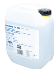
ref. 052246 Охлаждающая жидкость CORAGARD CS 330 - 10 л