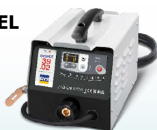
PROLINER 39.02 - ref. 035775 PROLINER 39.04 - ref. 035782