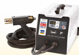
PROLINER ALU PRO FV - ref. 035836