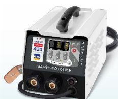
PROLINER PRO 230 - ref. 035799 PROLINER PRO 400 - ref. 035805