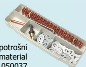
Jeklena škatla za potrošni material ref. 050037