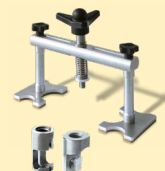
Alu izvlečni stroj ref. 051003