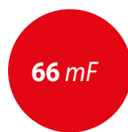
Speedliner alu Pro FV