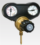
Regulator 30L/min 🇫🇷 041622 🇩🇪 041219 🇬🇧 🇪🇸 041646