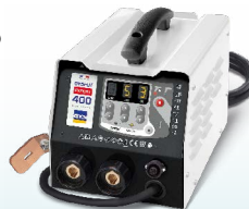
PROLINER PRO 230 - арт. 035799 PROLINER PRO 400 - арт. 035805