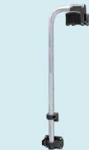
Робоча станція вішалка для кабелю ref. 052284