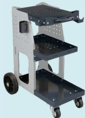
Візок Spot 800 ref. 051331