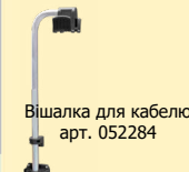
Вішалка для кабелю арт. 052284