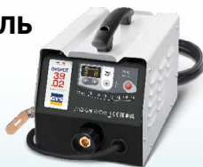
PROLINER 39.02 - арт. 035775 PROLINER 39.04 - ref. 035782