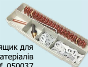
Сталевий ящик для витратних матеріалів ref. 050037