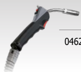
Push Pull Torch (24 V)