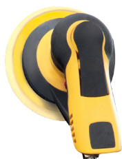
Pneumatisk orbitalsliber med \varnothing 150 mm polerpude MIRKA PRO S 650HK PN. 071346