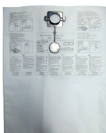
1 støvpose (PN. 058880 - 5 poser)