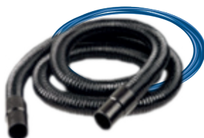
1 slange 3 m | \varnothing 29 mm