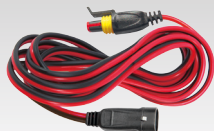
Verlängerungskabel 2.5 m - 029057