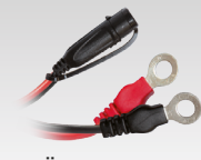
Öse-Stecker 45 cm - M6 029194