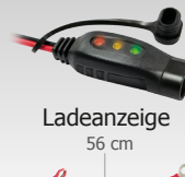
Ladeanzeige 56 cm