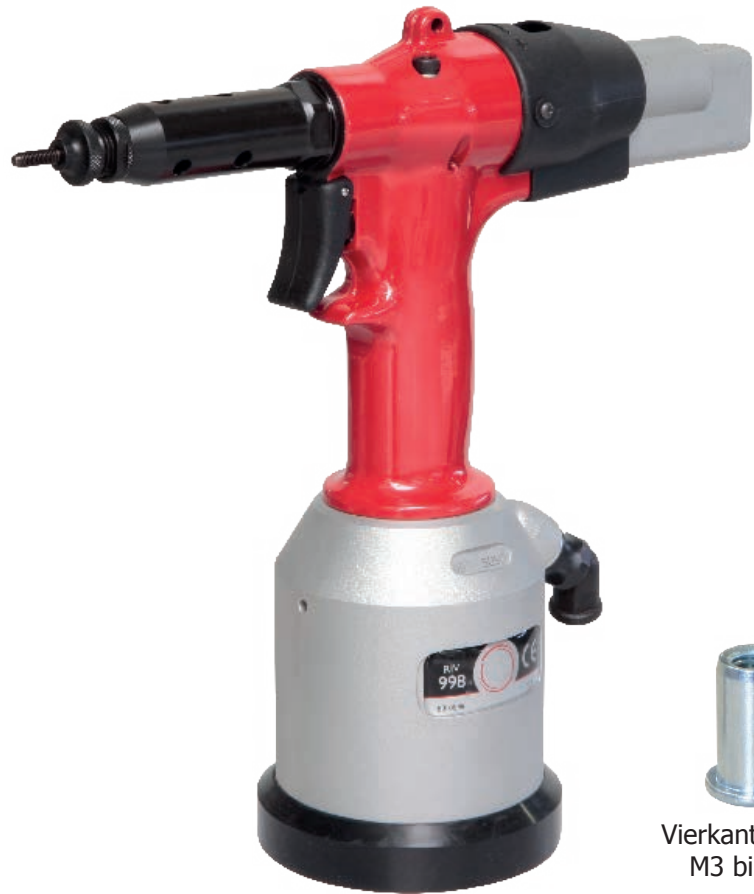
Vierkantsmuttern M3 bis M12