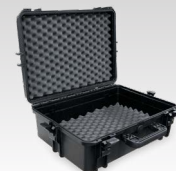
Baustellenkoffer IP67 060432