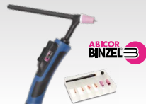
SR26DB - 4 m 038271