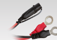
Conector terminal 45 cm - M6 029194