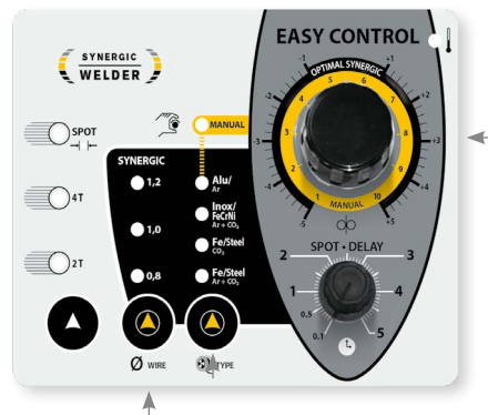
Sünergiaarežiim keevitusparameetrite otsese reguleerimisega