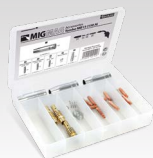
Taskulambi komplekt MB36 (350 A) 041417