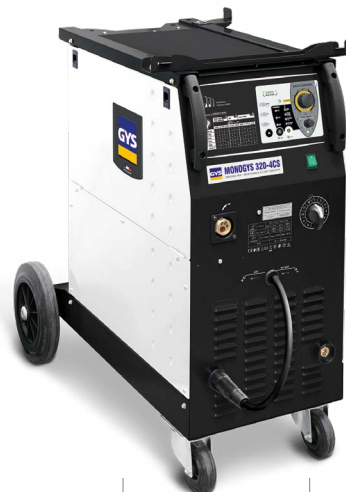
MIG Grip - Binzel® 350 A - 4 m