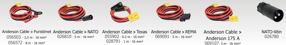
Anderson Cable > Puristimet 056503 - 2,5 m - 16 mm 2 056572 - 8 m - 16 mm 2