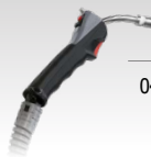
Stumiamasis degiklis (24 V)

046283 | 4 m | 3 kg | 220 A (20%) | 0,8 → 1,2