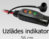
Uzlādes indikators 56 cm