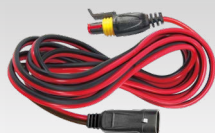
Pagarinājums 2,5 m - 029057