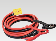
8 m - 16 mm 2 056572