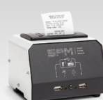
SPM : Printermodul 026919