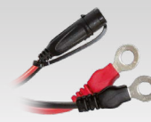
Eyelet-kontakt 45 cm - M6 029194