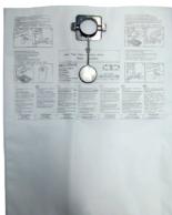
Worek na kurz nr kat. 058880 (x5)