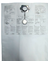
1 saco de pó (ref. 058880 - 5 sacos)