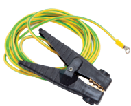
1 pinça de massa