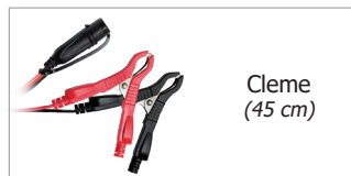
Cleme (45 cm)