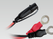
Conector terminal 45 cm - M6 029194