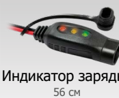
Индикатор зарядки 56 см