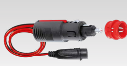
Комплект для прикуривателя 35 см - 029439