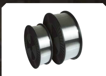
Drut aluminiowy (AlMg5)