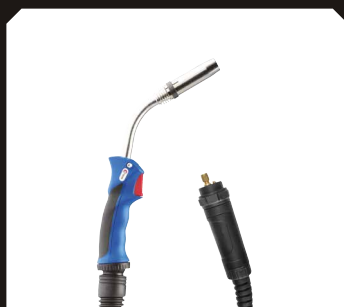
Palnik MIG/MAG Stal / Stal nierdzewna