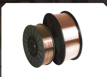
Drut stalowy (SG2) Drut ze stali nierdzewnej (316LSi)