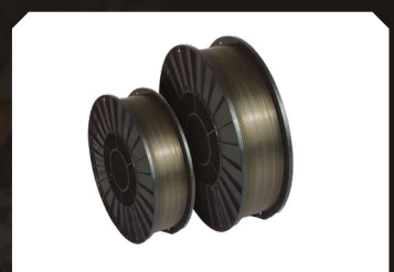
Drut rdzeniowy - stal