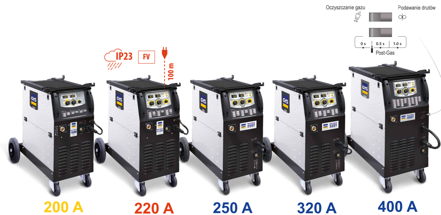
200 A 220 A 250 A 320 A 400 A